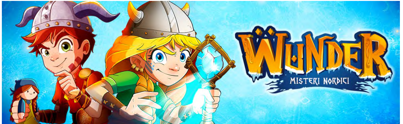
Il tema della 1ª, 2ª e 3ª settimana