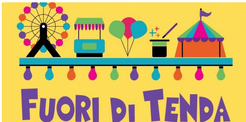
Il tema della 4ª settimana